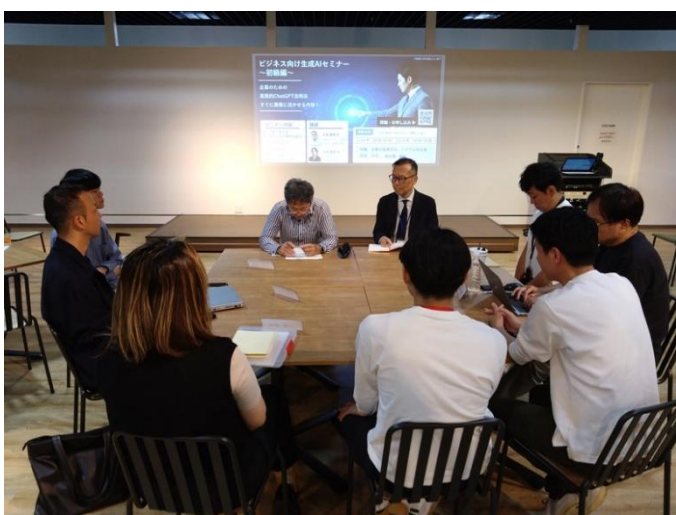
【元気印育成塾／勉強会】

創業を志す方を対象とした、無料のセミナーを優先的に受講できます。ベテランの中小企業診断士などの講師が、わかりやすく創業のノウハウを教えます。