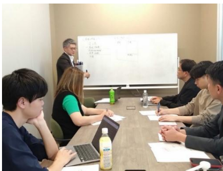
【第1回：2025年5月開催】 管理会計とは、損益分岐点売上高（BEP）、BEPの算出方法、演習問題の実施と解説