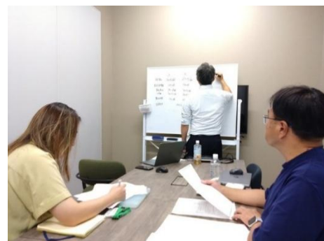
【第4回：2025年8月開催】 Vol.3の復習（感度分析）、演習問題の実施と解説、管理会計のまとめ