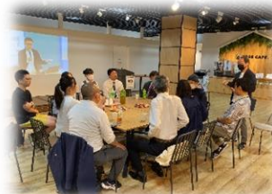
【創業支援セミナー参加者との交流会】