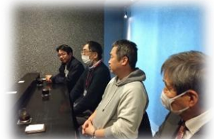
【先輩起業家からの体験学習】