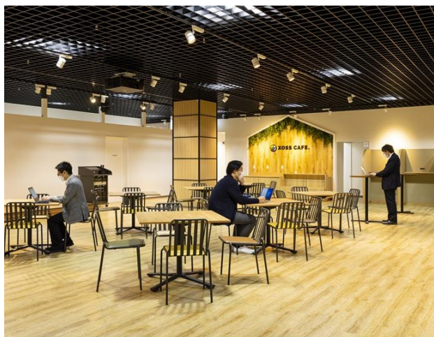
【XOSS POINT. オープンスペース】