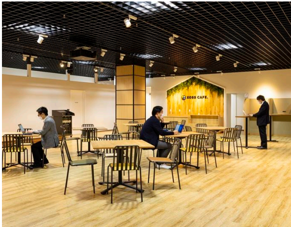
【XOSS POINT. オープンスペース】