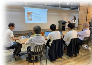
【事業内容プレゼンテーション発表会】

XOSS POINT.フリースペースで、主に創業支援セミナー受講者の方との交流会を行っています。お茶、お菓子を食しながら、アットホームな雰囲気です。参加費も無料です。