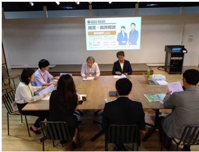
【元気印育成塾/勉強会】

創業を志す方を対象とした、無料のセミナーを優先的に受講できます。ベテランの中小企業診断士などの講師が、わかりやすく創業のノウハウを教えます。