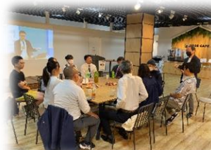
【創業支援セミナー参加者との交流会】

創業支援室の使用料は共益費以外無料です。使用期間は原則1年間。共益費は月額650円程度/m 2 、室のm 2 数により月額3,000~4,000円となります。また、プラザ図書館との連携で書籍やビジネスデータベースの閲覧なども有効活用頂けます。