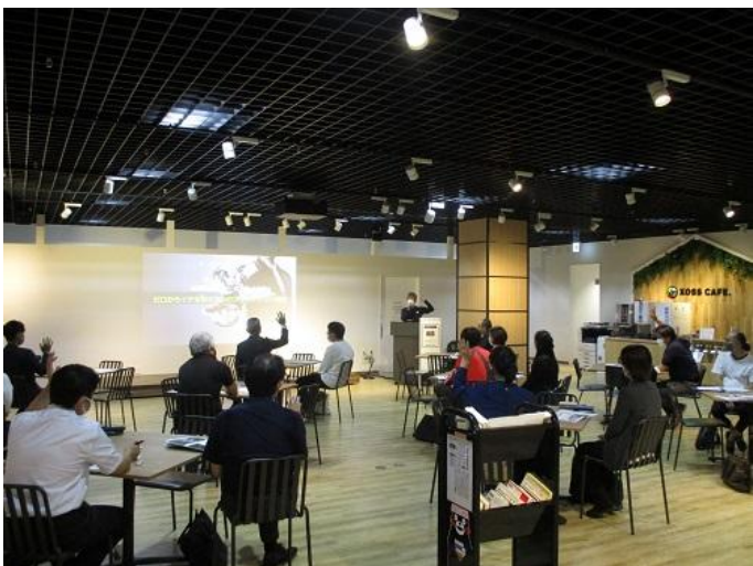
【創業支援セミナー風景】

創業を志す方を対象とした、無料のセミナーを優先的に受講できます。ベテランの中小企業診断士などの講師が、わかりやすく創業のノウハウを教えます。