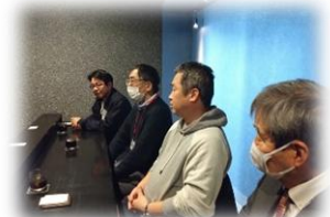
【先輩起業家からの体験学習】

毎月2回、セミナー形式の勉強会を無料で受講することができます。講師はXOSS POINT.専属の経営相談員(中小企業診断士)です。