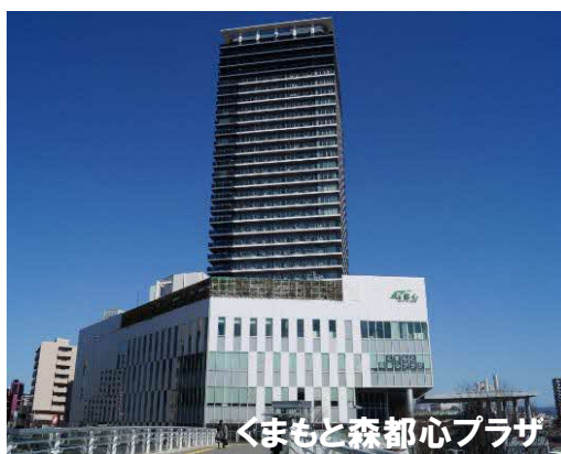
くまもと森都心プラザ